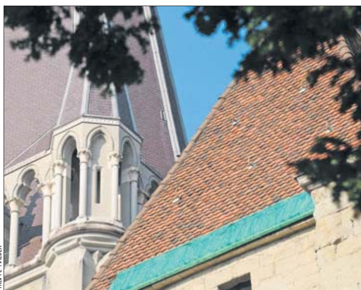
Des bâches vertes sont apparues ces derniers mois au bord des toits. Elles servent de premier rempart lors de glissades de tuiles.

Ces derniers pourraient débiter dès 2010. Un crédit d'étude qui permettra de cibler les zones de l'édifice où des interventions sont nécessaires, notamment sur