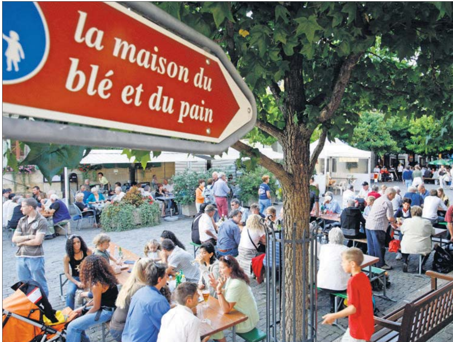
FOULE L'affluence due à la Fête du blé et du pain n'est pas sans conséquences pour les commerçants. Les grands bénéficiaires sont les vendeurs de denrées alimentaires ÉCHALLEN, LE 25 AOÛT 2008

Cette façon de prendre les choses avec philosophie se retrouve chez d'autres commerçants lésés. «Il est difficile d'estimer ce qui est perdu et ce qui sera simplement reporté après la fête, constate Jean-Marc Goumaz, de la boutique de mode Espace