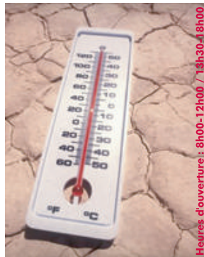
Heures d'ouverture: 8h00-12h00 / 13h30-18h00